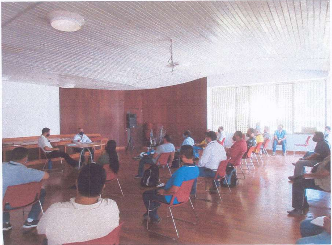
Primera reunión de trabajo entre los jefes de las unidades del Parque Nacional Tikal y la Administración para elaborar la planificación de trabajo del año 2021.