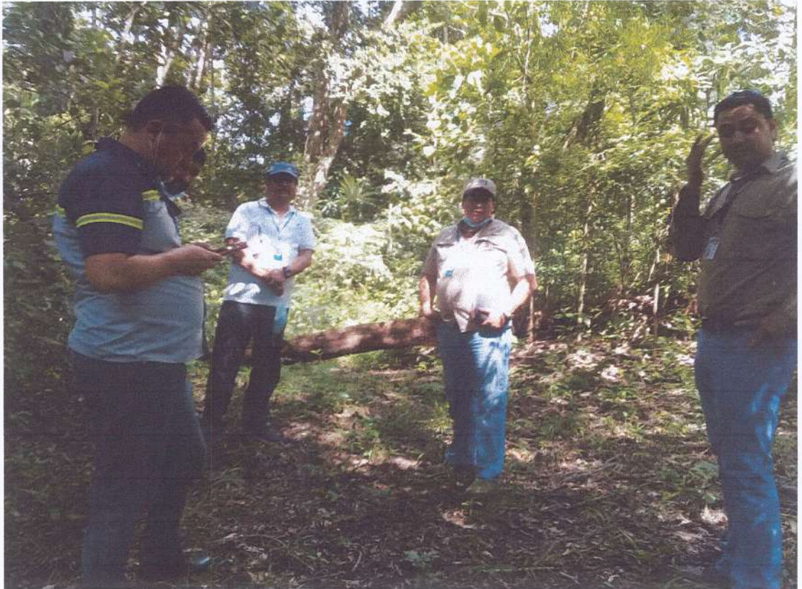
Se atendió la visita de técnicos de GUATEL que se encuentran evaluando la posibilidad de introducir internet para proporcionar señal de Wi Fi a los visitantes