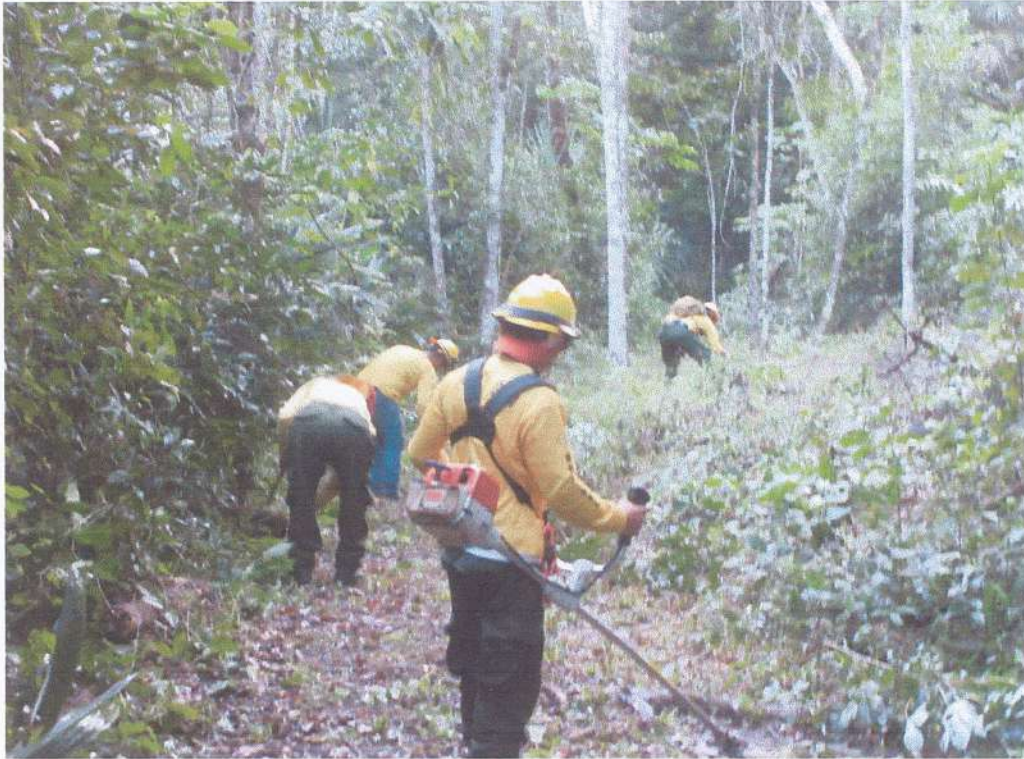
Limpeza de 25 kilómetros lineales de la brecha límite sur del Parque con el apoyo de personal de la CONRED en el marco del Proyecto de Biodiversidad de USAID y el Bloque Bio Itza-Zots-Tikal-Cahui-Yaxha-Nakum-Naranjo.